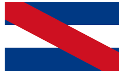
Bandera de Misiones