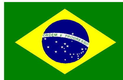
Bandera de Brasil