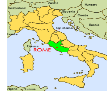
Mapa del Vaticano en Europa

http://ellendriscoll.com/wp-content/uploads/2011/10/Roma-Lazio.png