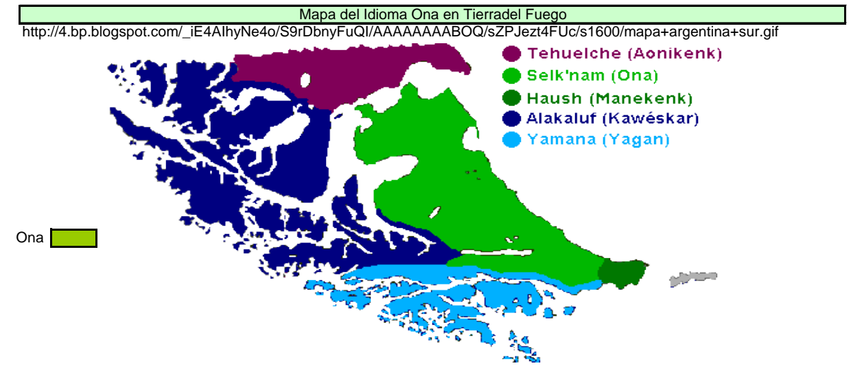
Mapa del Idioma Ona en Argentina https://www.google.com.ar/webhp?sourceid=chrome-instant&ion=1&espv=2&ie=UTF-8#q=mapa%20chorote Pueblos indígenas de la Argentina actual