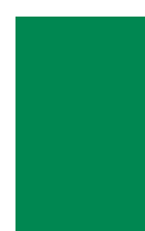
Bandera de Nigeria

Los países que se analizan corresponden a migraciones forzadas (Siglos 16 a 19) y libres (Siglos 19, 20 y 21)