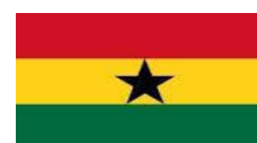
Bandera de Ghana