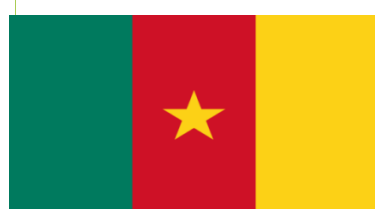
Bandera de Camerun