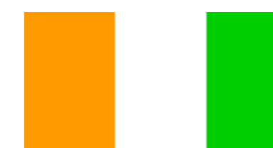
Bandera de Costa de Marfil