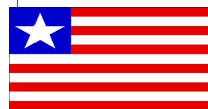
Bandera de Liberia