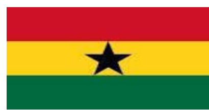
Bandera de Ghana