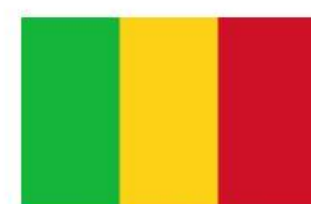
Bandera de Mali