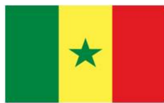
Bandera de Senegal