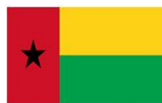
Bandera de Guinea Bisau