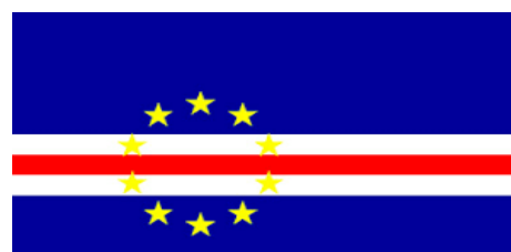
Bandera de Cabo Verde