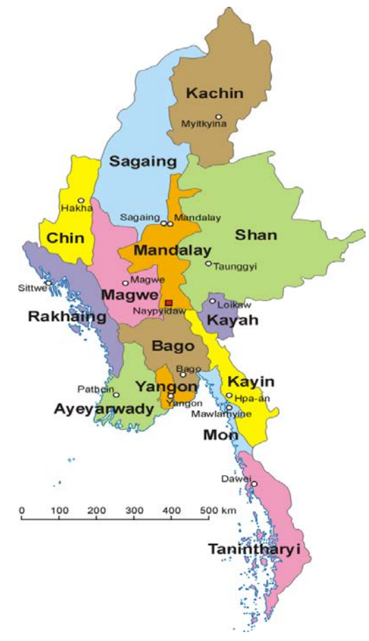
Mapa del Idioma Birmano en Asia

http://www.noticiaspia.com.ar/wp-content/uploads/Mapa-de-Birmania1.png