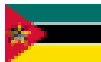
Bandera de Mozambique