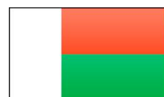
Bandera de Madagascar