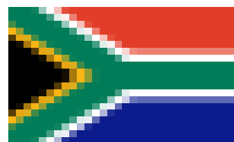
Bandera de Sudafrica