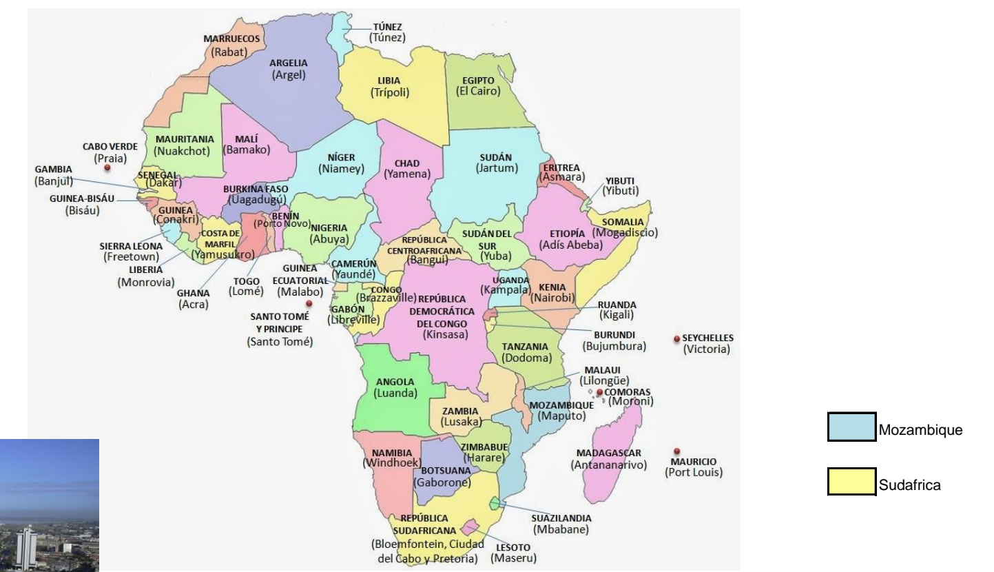
Mapa Político del Africa