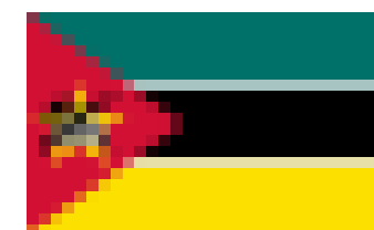
Bandera de Mozambique