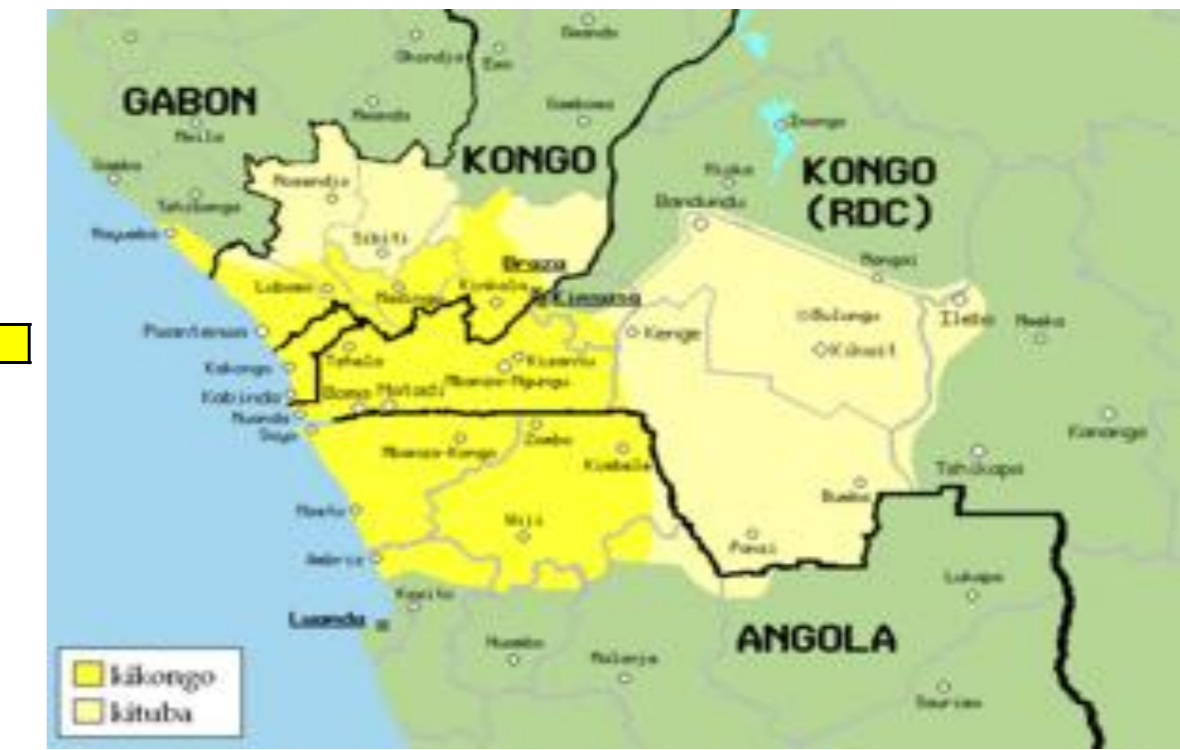
Mapa Politico del Africa