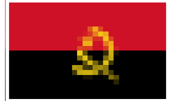
Bandera de Angola