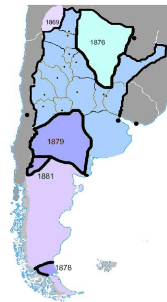
Censos Fechas de incorporacion al territorio nacional

Presencia La poblacion de origen africano declina fuertemente desde la época virreynal hasta nuestros días, pasando del 24 % al 0,4 % Causas de la desaparicion de la poblacion Africana = 01. Primera Invasión Inglesa a Buenos Aires (1806 a 1807) 02. Ejército del Norte (1812) (De 1.200, 800 = 67% eran Afro) 03. Combate de San Lorenzo (1813) 04. Ejército de Los Andes (Batallas de Maipu, Chacabuco, Cancha Rayada y Campaña del Alto Perú) (1816/23) (De 5.000 milicianos, 2.500 Afros = 50%, vuelven 143) 05. Primera Batalla de Cepeda (1820) 06. Guerra contra Brasil (1825 a 1828) 07. Milicias en la frontera interior (lucha contra el indio) 08. Batalla de Caseros (1852) 09. Segunda Batalla de Cepeda (1859) 10. Batalla de Pavon (1861) 11. Guerra de la Triple Alianza (1865 a 1871) 12. Primera Epidemia de cólera (1867) 13. Emigracion al Uruguay de Poblacion Afro (Fines Siglo 19) 14. Fiebre amarilla (1871) 15. Segunda Epidemia de cólera (1887) 16. Tercera Epidemia de cólera (1894 a 1895) 17. Inmigracion Europea de grandes proporciones a partir de mediados del Siglo 19 y mitad del Siglo 20 (1880 a 1950) alterando el porcentual afro vs total poblacion Actividades = Tareas rurales, ganaderia, trabajo domestico o labores artesanales, y traslados a las minas de Potosi, por el Camino Real. En el siglo 19, incorporacion a las milicias.