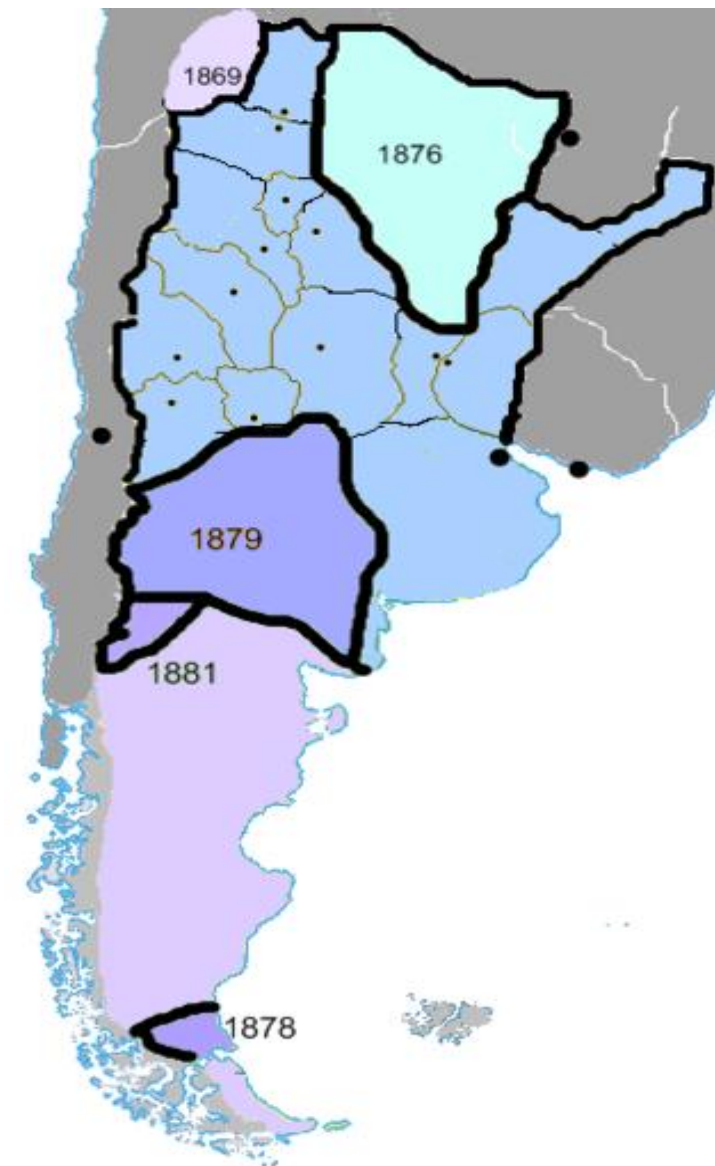
Censos Fechas de incorporacion al territorio nacional