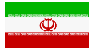
Bandera de Iran