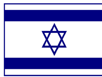
Bandera de Israel