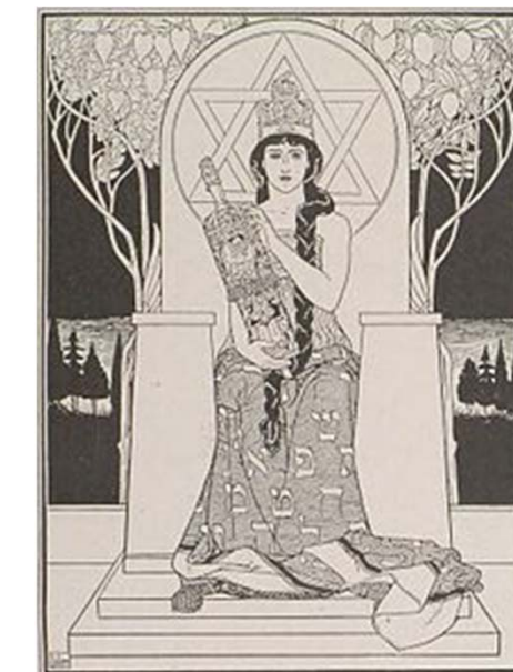
... preservada en esta estampa de Lilien por La reina del Shabat, en cuyo vestido figuran los caracteres empleados por el idioma hebreo