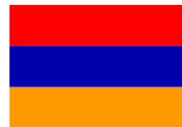
Bandera de Armenia