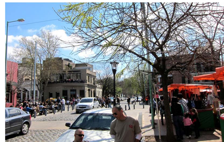
La plaza "Palermo viejo" ahora es "Inmigrantes de Armenia"