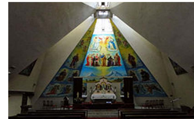
Iglesia Católica Armenia en Buenos Aires