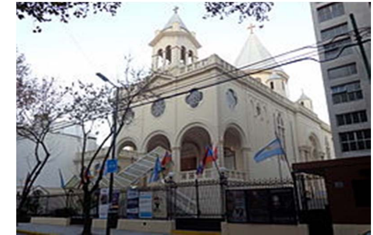
Centro Armenio en Buenos Aires, en la calle "Armenia".