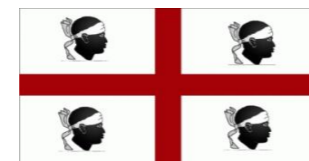
Bandera de Cerdeña