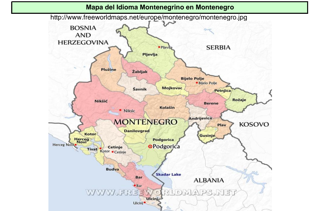
Mapa de Montenegro en Europa http://upload.wikimedia.org/wikipedia/commons/f/fc/Location_Montenegro_Europe.png