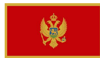
Bandera de Montenegro

% = Hablantes del Idioma en el Pais de Origen