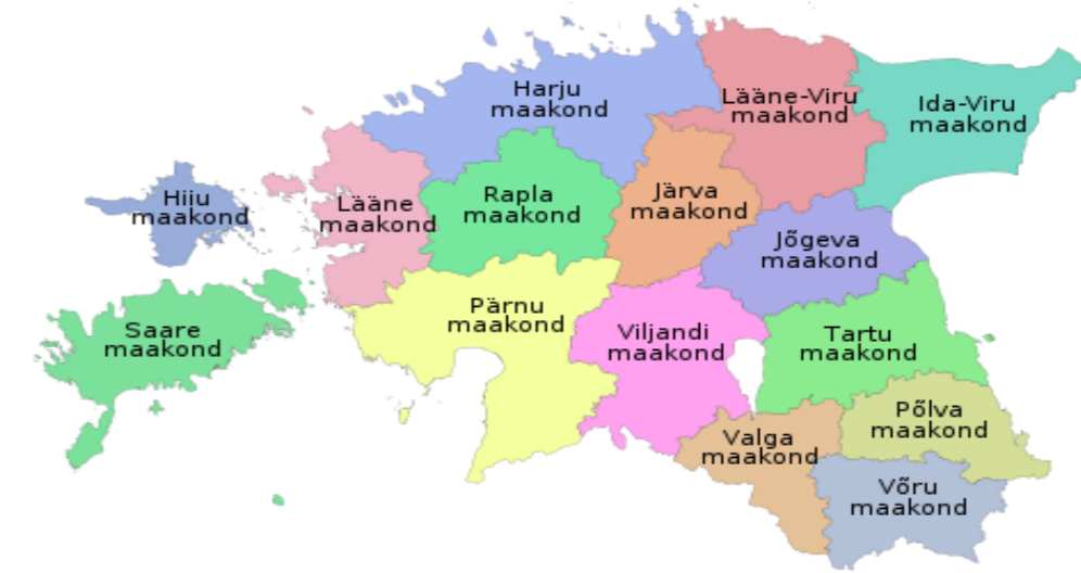
Mapa de Estonia en Europa

https://upload.wikimedia.org/wikipedia/commons/thumb/0/06/Eesti_maakonnad_2006.svg/750px-Eesti_maakonnad_2006.svg.png