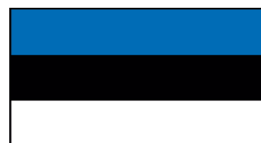
Bandera de Estonia

% = Hablantes del Idioma en el Pais de Origen