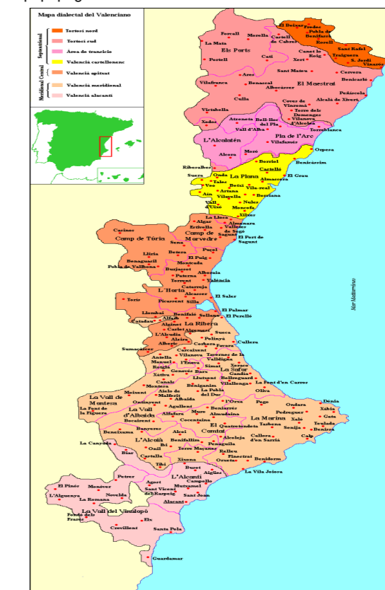
Mapa del Idioma Valenciano en España http://www2.luenticus.org/mapas/espanacomunidades/comunidadvalenciana.gif