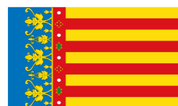
Bandera de Valencia

% = Hablantes del Idioma en el País de Origen