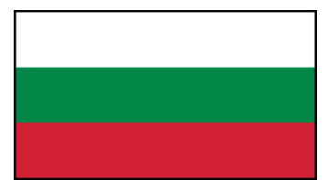
Bandera de Bulgaria

% = Hablantes del Idioma en el Pais de Origen