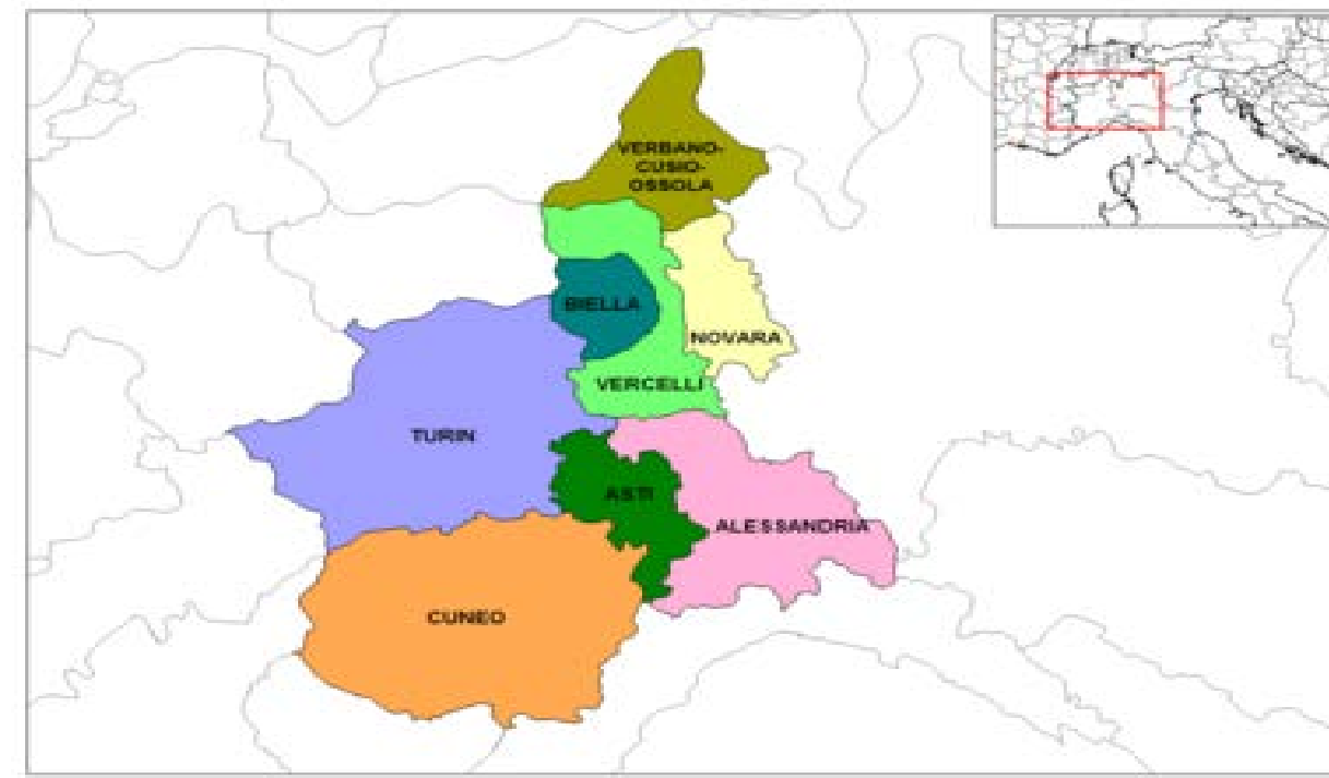
Mapa del Idioma Piamontés en Italia http://upload.wikimedia.org/wikipedia/commons/thumb/0/06/Map_Region_of_Piemonte.svg/172px-Map_Region_of_Piemonte.svg.png