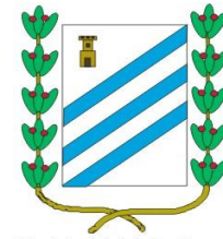
Municipalidad de San Ramon de la Nueva Oran