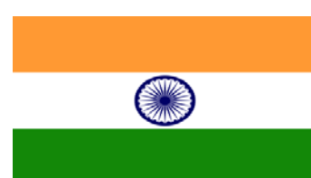
Bandera de India