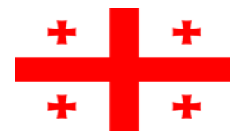
Bandera de Georgia