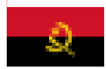
Bandera de Angola