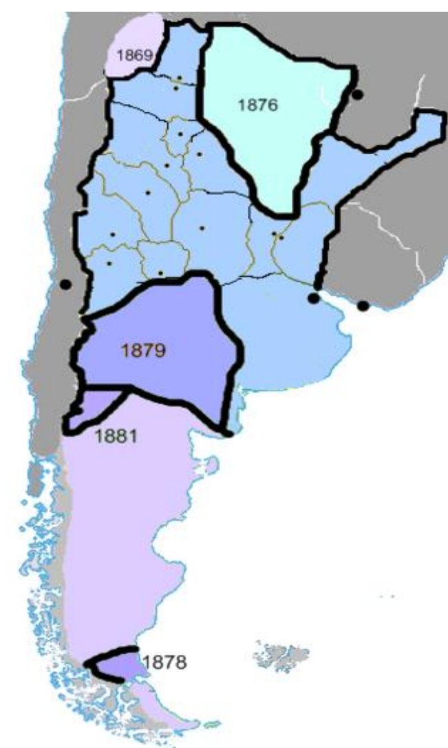
Censos Fechas de incorporacion al territorio nacional