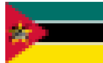
Bandera de Mozambique