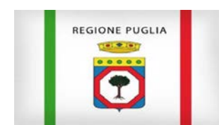
Bandera de la Puglia