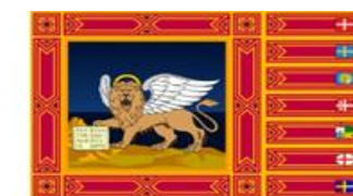
Bandera del Veneto