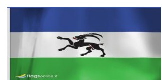
Bandera de los Ladinos

% = Hablantes del Idioma en el Pais de Origen s/d = Sin Datos